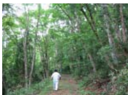
筆者が疲れきって縦走コースを試走(試歩?)している情けない後姿です。選手の皆様の大変さが身に染みて判りました。