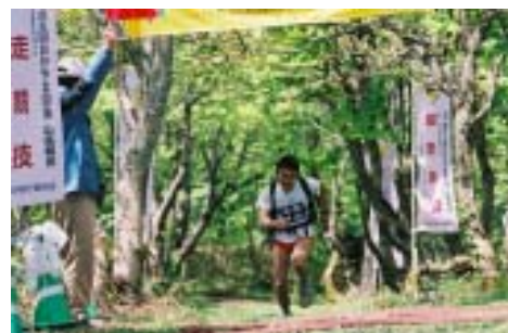
縦走コース・リハーサルでの試走風景です。まさに「青春」を表現しているのではないのでしょうか？選手全員の方々に「金メダル」を呈呈したい心境になりました。

！「全盛の現代社会に於いて、日常生活がどれだけ快適になるうとも私達には決して作り出せないものがあります。それは自然が織りなすおおらかな包容性に満ちた世界です。弊社は、様々な事業を通じて環境保全への視点を保ちながら、住産業との快適な共存関係を目指して行きます。木々の緑の輝きに感動する心を決して失わない企業で在りたいと考えております。