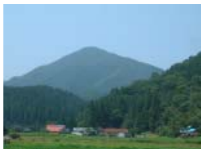
笠杖山です。その美しさより別名「新庄富士」と呼ばれています。新庄盆地の景観を美しく引き立ててくれ「故郷の富士百選」に選ばれた自慢の山です。

その中で、弊社が所有する岡山県新庄村の山林が、本年秋に開催される「晴れの国・おかやま国体」の山岳競技・縦走コースにご指定を頂きました（縦走競技開催日；平成 17 年 10 月 24 日・毛無山山系金ヶ谷山特設縦走競技場）。準備作業もほぼ完了し、後は選手の皆様を待つばかりの状態です。